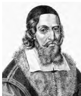
Ян Амос Коменский

Учащимся школ нового типа – коллегий – раз в неделю предоставлялся рекреационный (свободный) день, который, в основном, использовался для прогулок и походов с познавательными целями. [4] Разрабатывая программу общедоступных средних школ для Чешского королевства в середине XVI века, Я.А. Коменский предлагал: «...в конце обучения два или три года останутся для путешествий». [5]