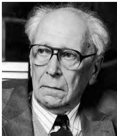
Дмитрий Сергеевич Лихачев

только научно-просветительской, но и общественной деятельности. Это явственно отражало и усиление самостоятельной роли провинции в нашей общественно-политической жизни, в развитии культуры.