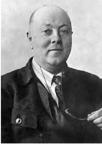
Александр Евгеньевич Ферсман

оценивший возможную пользу походов, писал, что «от туризма мы переходим к целому ряду этапов нашей работы в области не только научных открытий, но и завоеваний большого хозяйственного значения». [10]