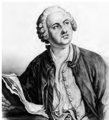
Михаил Васильевич Ломоносов

в 1762 году «Топография Оренбургская» П.И. Рычкова, где освещалась и история этой сравнительно новой в составе России области. Интересно, что в 1759 году Петр Иванович Рычков стал первым членом-корреспондентом Академии наук.