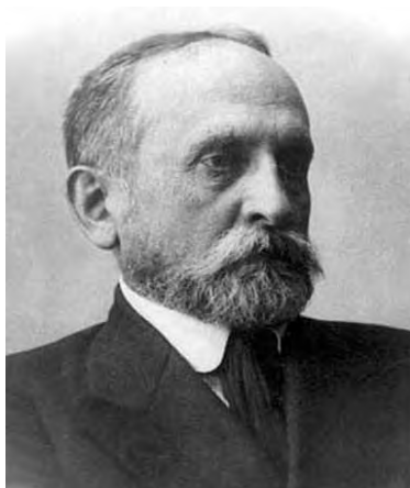
Сергей Федорович Ольденбург

охрана и популяризация. Эта работа осуществлялась преимущественно силами специалистов и населения на местах в форме общественно полезной деятельности. По существу, краеведение 1920–1930-х годов развивалось как общественно-государственная система. Основная масса краеведов работала на общественных началах, а исполнительные органы (ЦБК и его местные отделения) финансировались из средств государственного бюджета. По аналогичному принципу создавалась и действует ныне и система школьного краеведения.