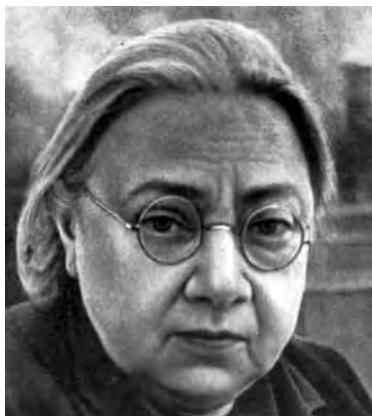
Надежда Константиновна Крупская

школой научной работы для будущих академиков (М.Н. Тихомирова, Н.М. Дружинина, А.П. Окладникова). Именно тогда были выработаны научные приемы изучения повседневности и микроистории, которые опередили мировую науку. И ныне, с возрастанием во всем мире внимания к такой научной проблематике, наш российский опыт вызывает особый интерес.