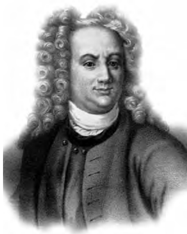
Василий Никитич Татишев

Во второй половине XVIII века начинают появляться описания отдельных областей, большую часть которых занимает характеристика их экономики. Первым таким описанием была напечатанная