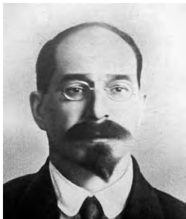
Анатолий Васильевич Луначарский

Туристско-краеведческая деятельность в период до 1928 года сосредоточивается во внешкольных учреждениях и проводится, в основном, в форме многодневных (6–10 дней) экскурсий, путешествий, так называемых «кочевок». [5]