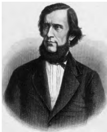
Константин Дмитриевич Ушинский

краеведческой основе позднее подерживал Л.Н. Толстой.