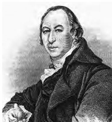
Николай Иванович Новиков

На первый план выступает идея прагматизации знания, возможность его практического применения. Так, в книге Ф. Гансберга «Творческая работа в школе», переведенной с немецкого языка и изданной в 1913 году, прямо говорится, что «...всякое знание имеет значение лишь постольку, поскольку оно может быть применено к современности и к будущему, к нашей жизни и к развитию человечества. Применимость – вот пробный камень для всякого