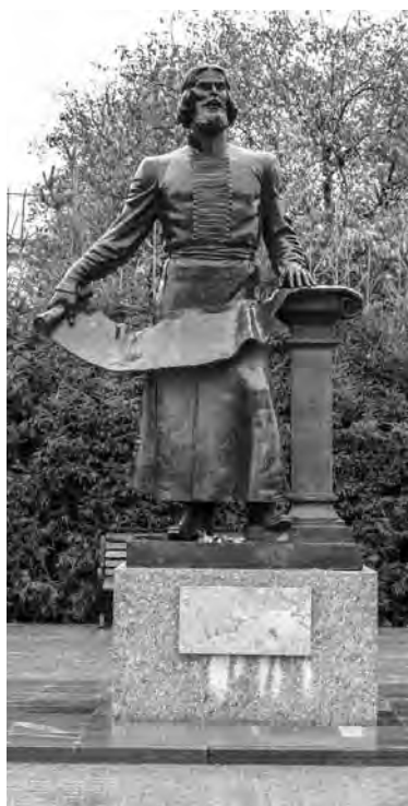
Семен Ульянович Ремезов

Начало стимулируемых краеведческих исследований относится также к началу XVIII века и связано с указом Петра I от 13 февраля 1718 года, в котором предписывалось докладывать царю обо всех любопытных находках, а тех, кто их обнаружит, — награждать: «Тако же, если кто найдет в земле или в воде какие старые вещи, а именно: камня необыкновенные, кости человеческие или скотские, рыбы или птичьи, не такие какие у нас ныне есть, или и такие, да зело велики или малы перед обыкновенными; также какие старые надписи на камнях, железе или меди, или какое старое, необыкновенное ружье, посуду или прочее все, что зело старо и необыкновенно — таже бы приносили, за что будет довольная дача» (Полн. собр. соч. законов Российской Империи. Т. 5. № 3259). [6]