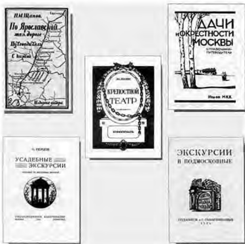
Краеведческие издания 1920-х годов

С 11 по 14 декабря 1927 г. прошла III Всероссийская конференция по краеведению. Н.К. Крупская отметила громадное значение краеведения для народного образования. Если дореволюционное краеведение, говорила она, занималось узким кругом вопросов, теперь под давлением жизни, под давлением снизу необходимо расширить краеведческие исследования. Из выступления академика