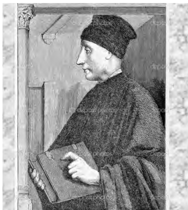
Витторино да Фельтре. 1378–1446

В конце XVII – начале XVIII века в школах Италии, Англии, Франции, Германии, Австрии, Швейцарии и других стран