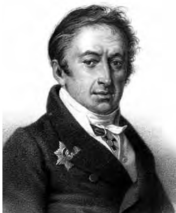
Николай Михайлович Карамзин

С середины 1830-х годов в губерниях и волостях появляются статистические комитеты. С 60-х годов XIX века они стали регулярно публиковать отчеты о своей деятельности и результаты исследований, к осуществлению которых привлекалась обычно и широкая